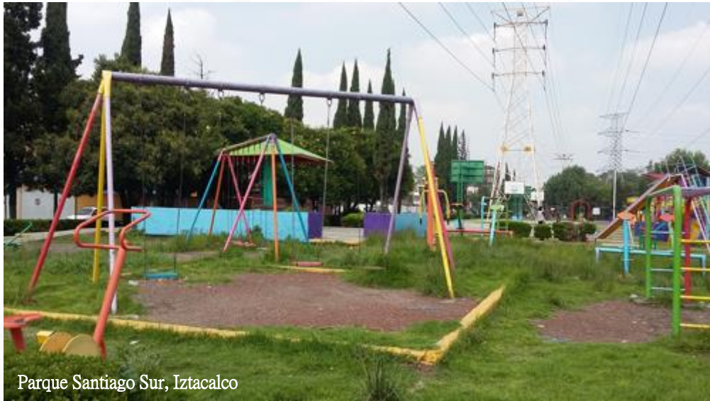
Parque Santiago Sur, Iztacalco