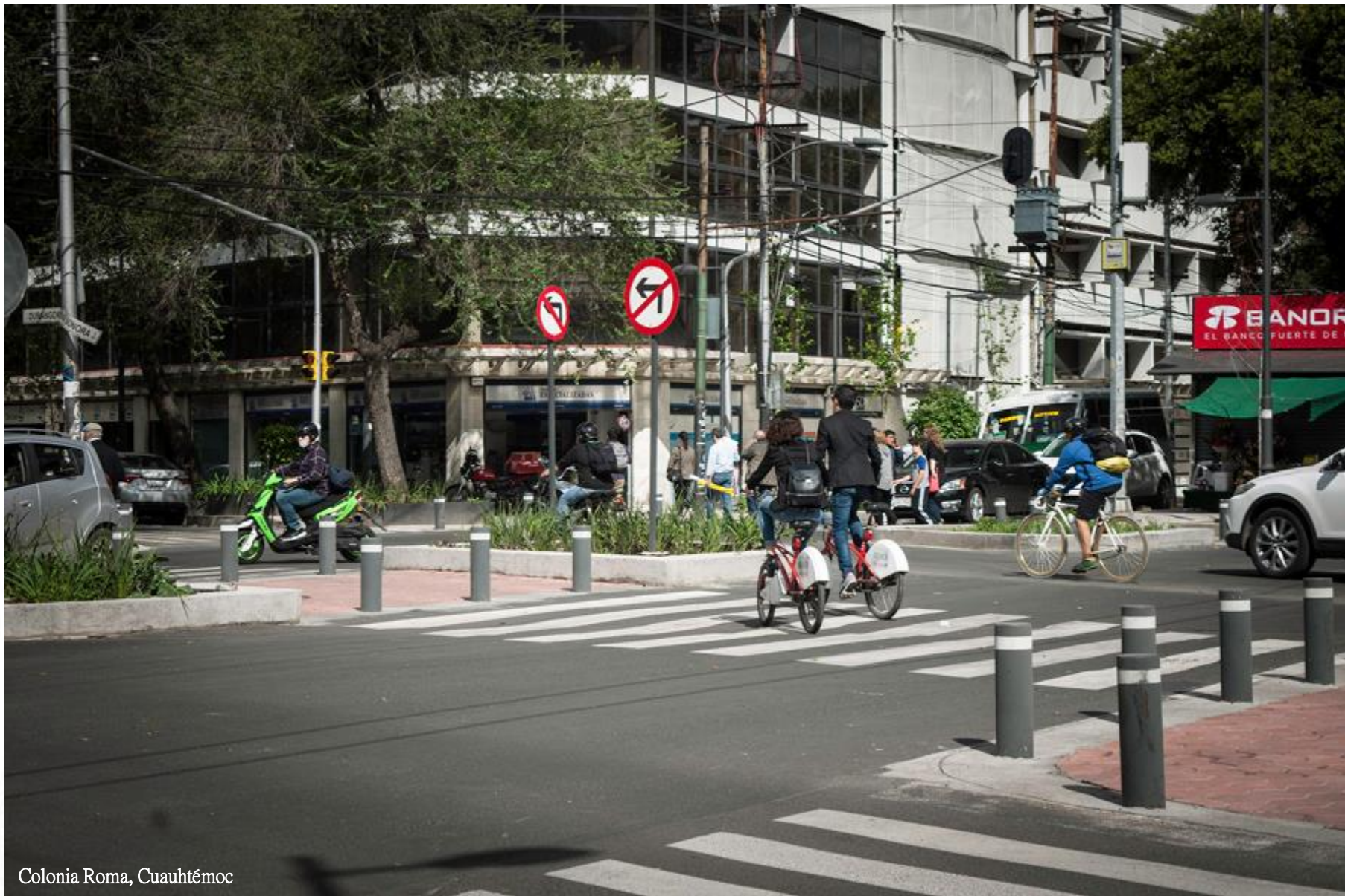
Colonia Roma, Cuauhtémoc