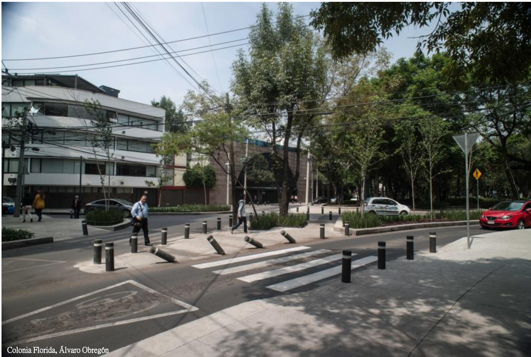
Colonia Florida, Álvaro Obregón