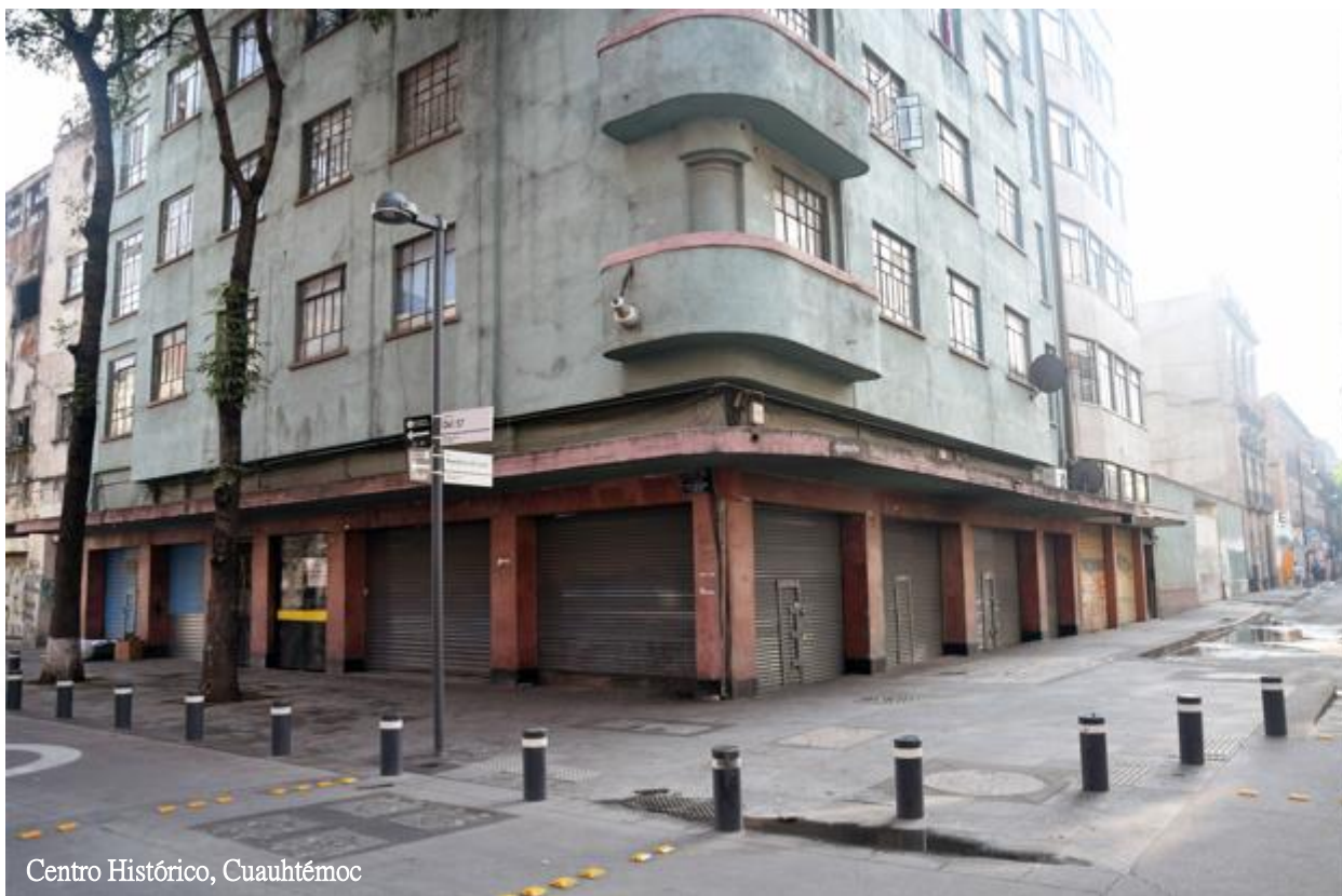
Centro Histórico, Cuauhtémoc