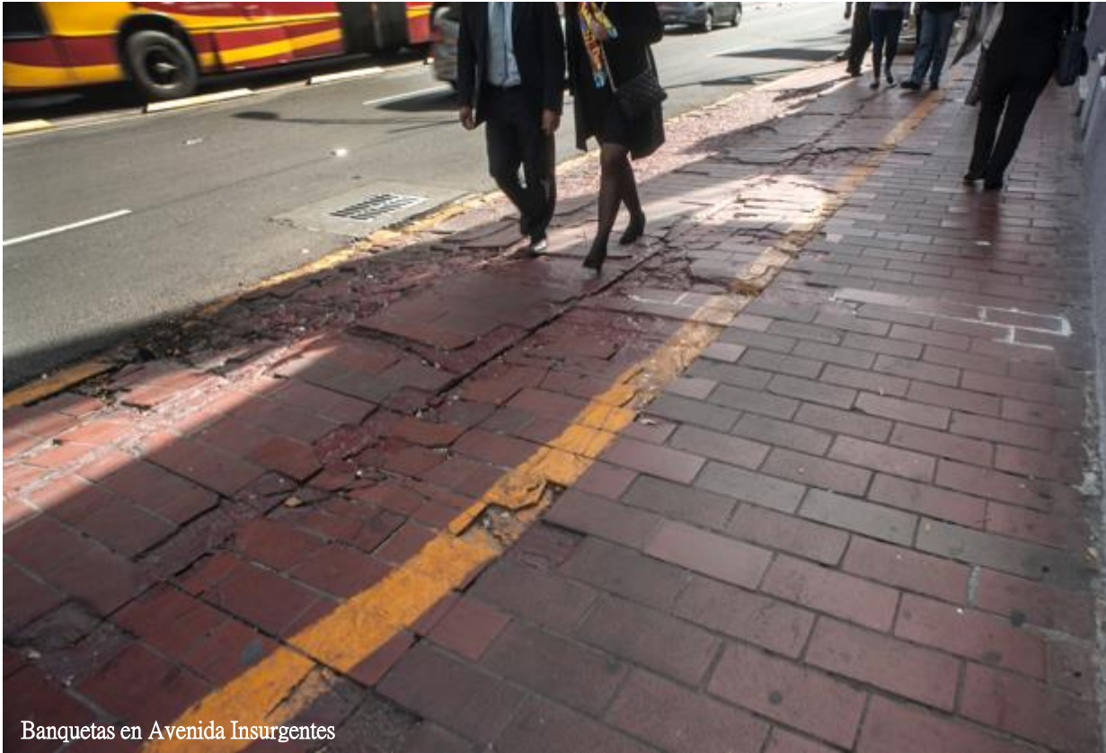
Banquetas en Avenida Insurgentes