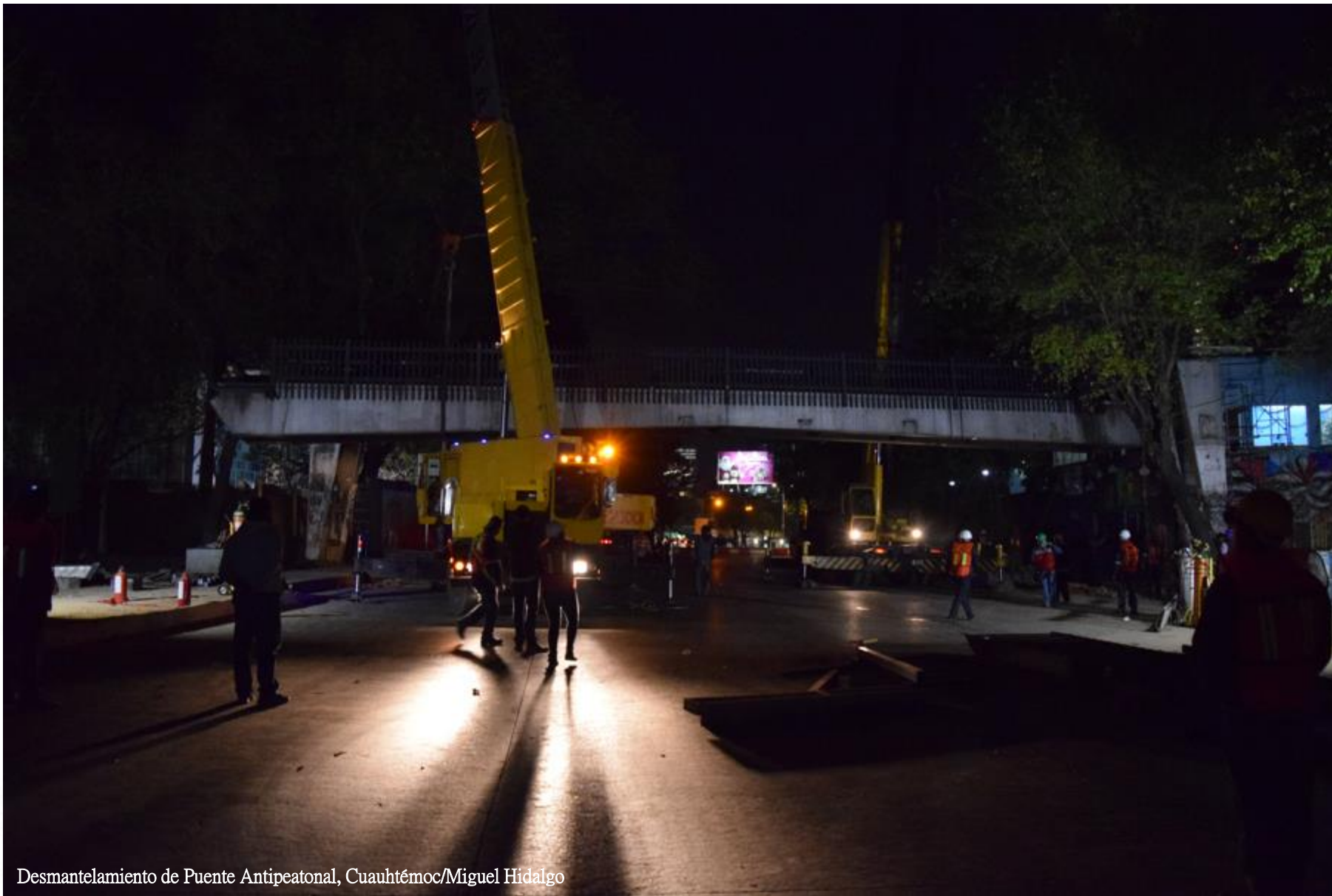
Desmantelamiento de Puente Antipeatonal, Cuauhtémoc/Miguel Hidalgo