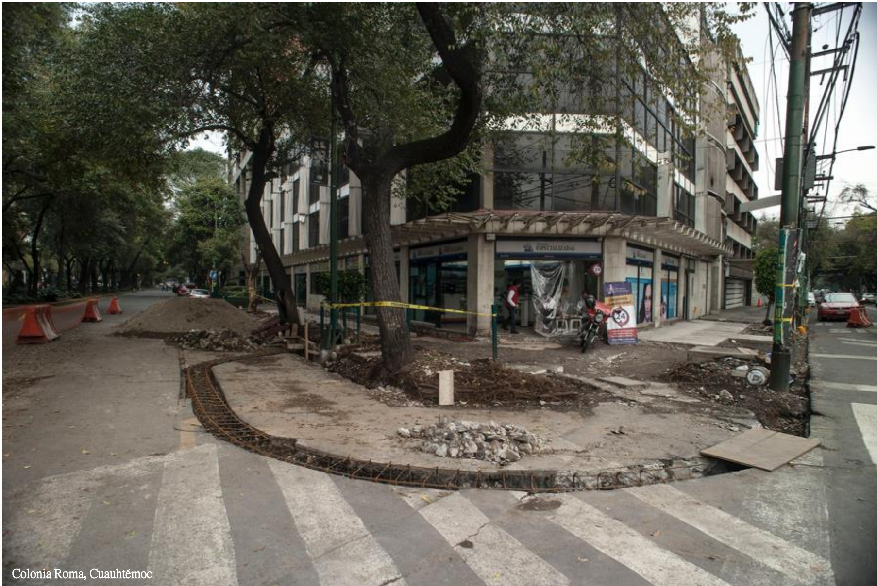
Colonia Roma, Cuauhtémoc