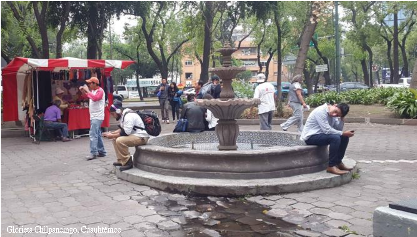
Glorieta Chilpancingo, Cuauhtémoc