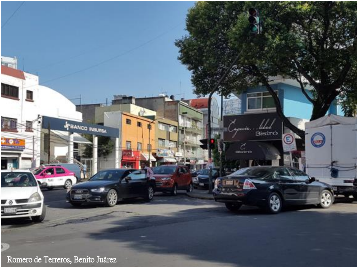
Benito Juárez