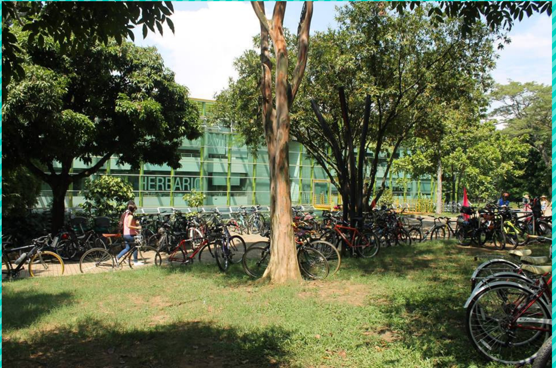
Jardín Botánico Joaquín Antonio Uribe, En busca de los gigantes invisibles (Medellín, noviembre de 2016)