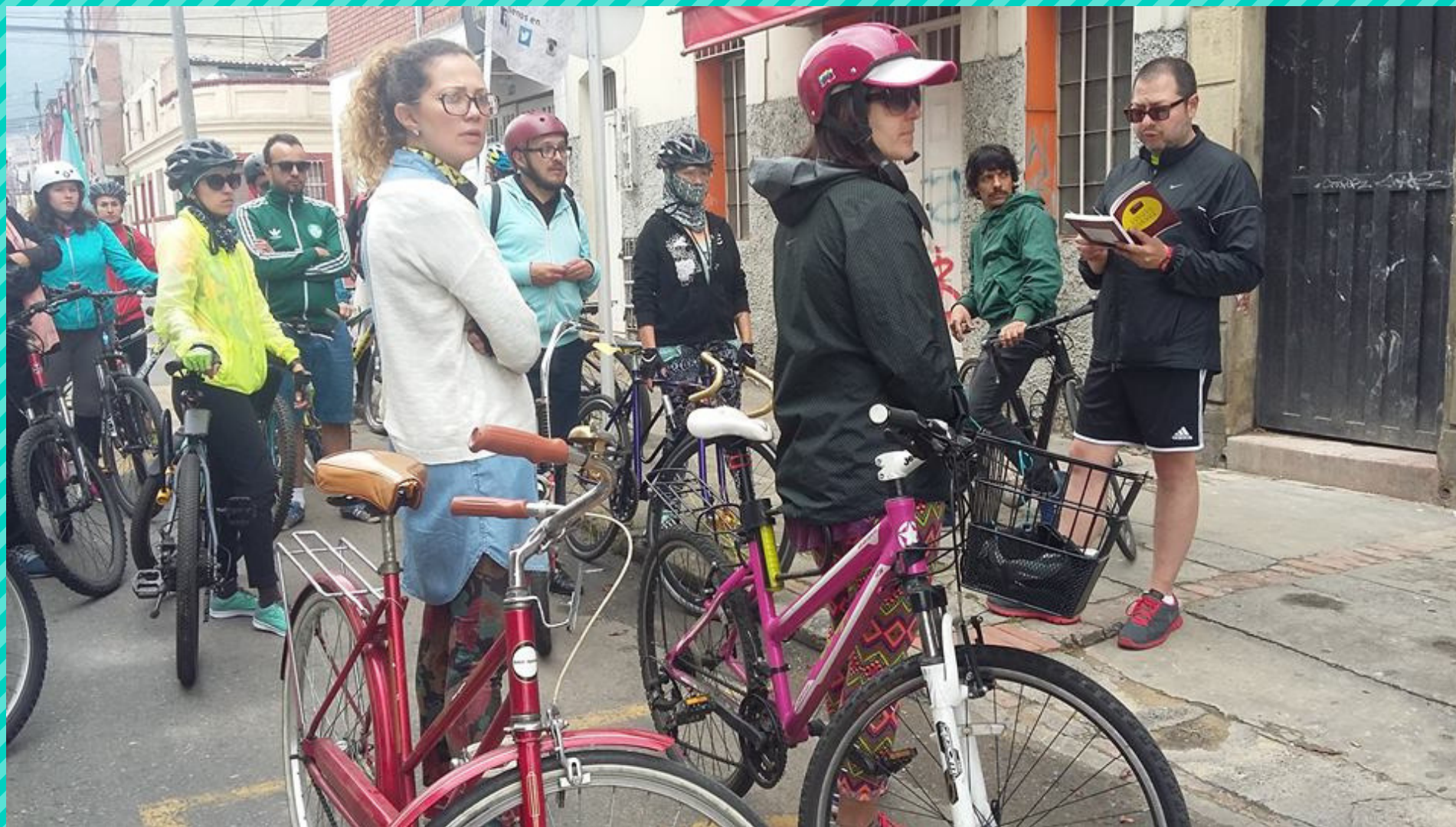
"Todo pasa pronto", de Juan David Correa (febrero de 2017)