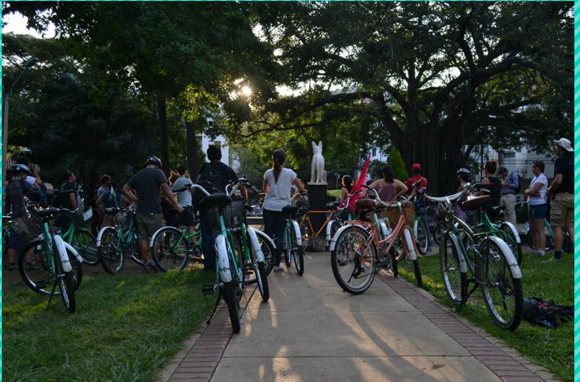
Parque del Perro, ¡Nos vemos en el río! (Cali, octubre de 2016)