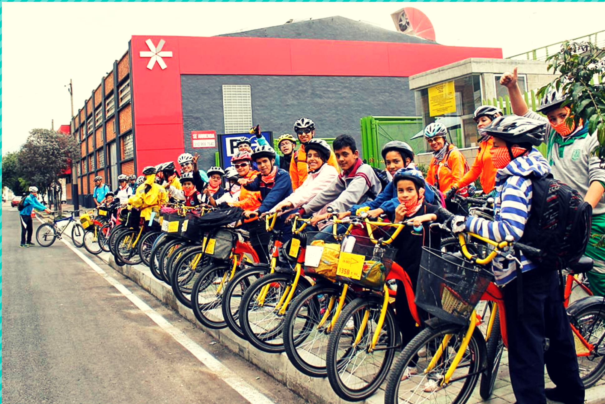
A la FILBo en bici (2016)