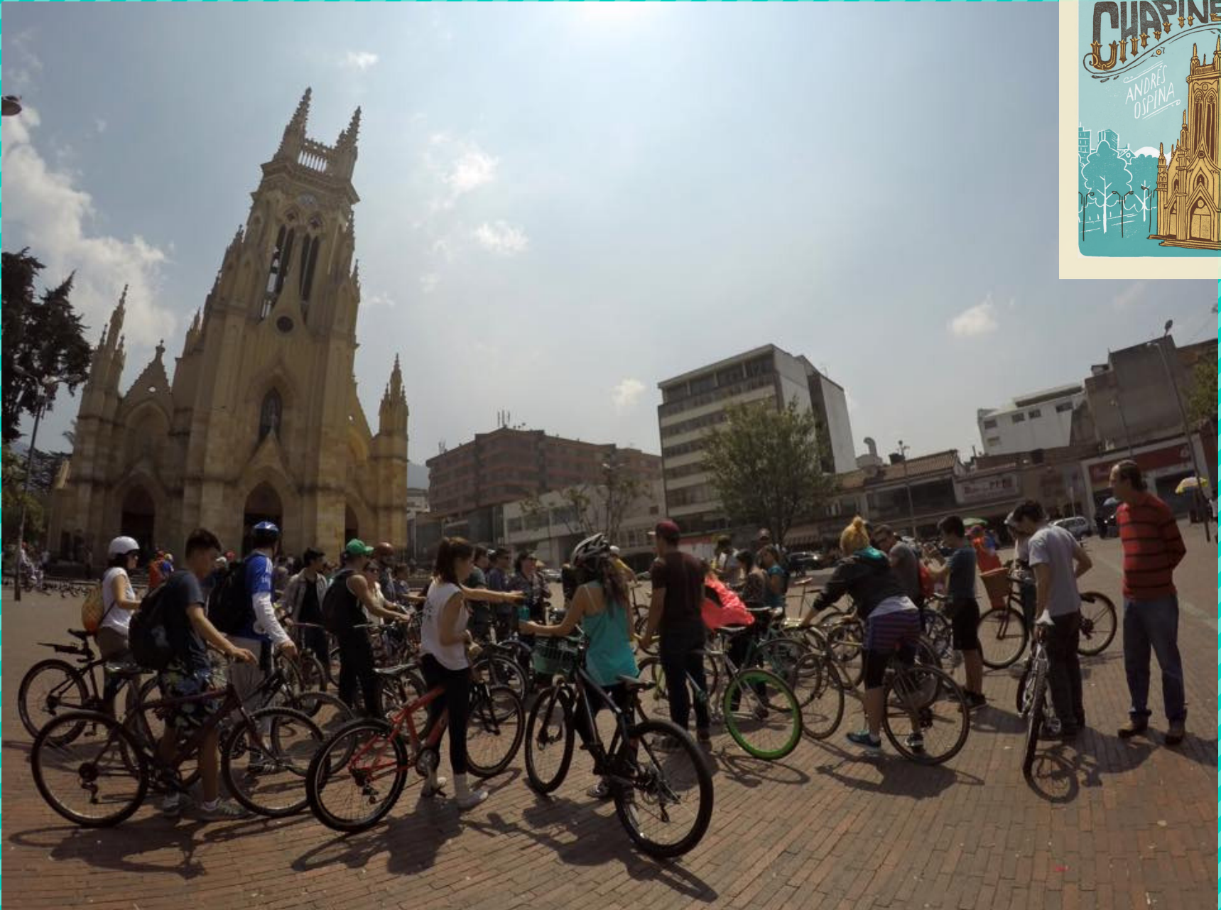
"Chapinero", de Andrés Ospina (enero de 2016)