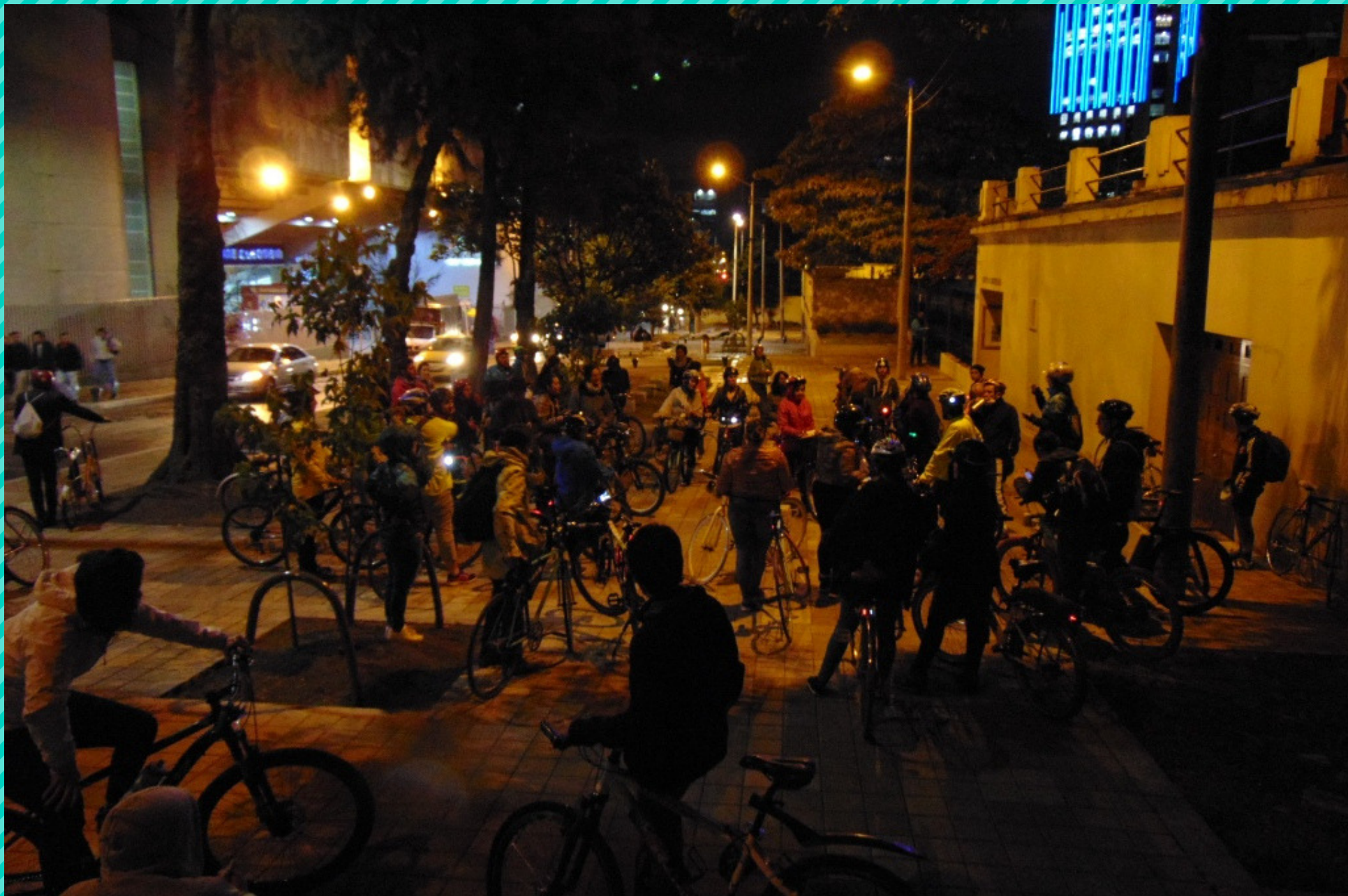
Salsa en bici con Alberto Bejarano (julio de 2017)