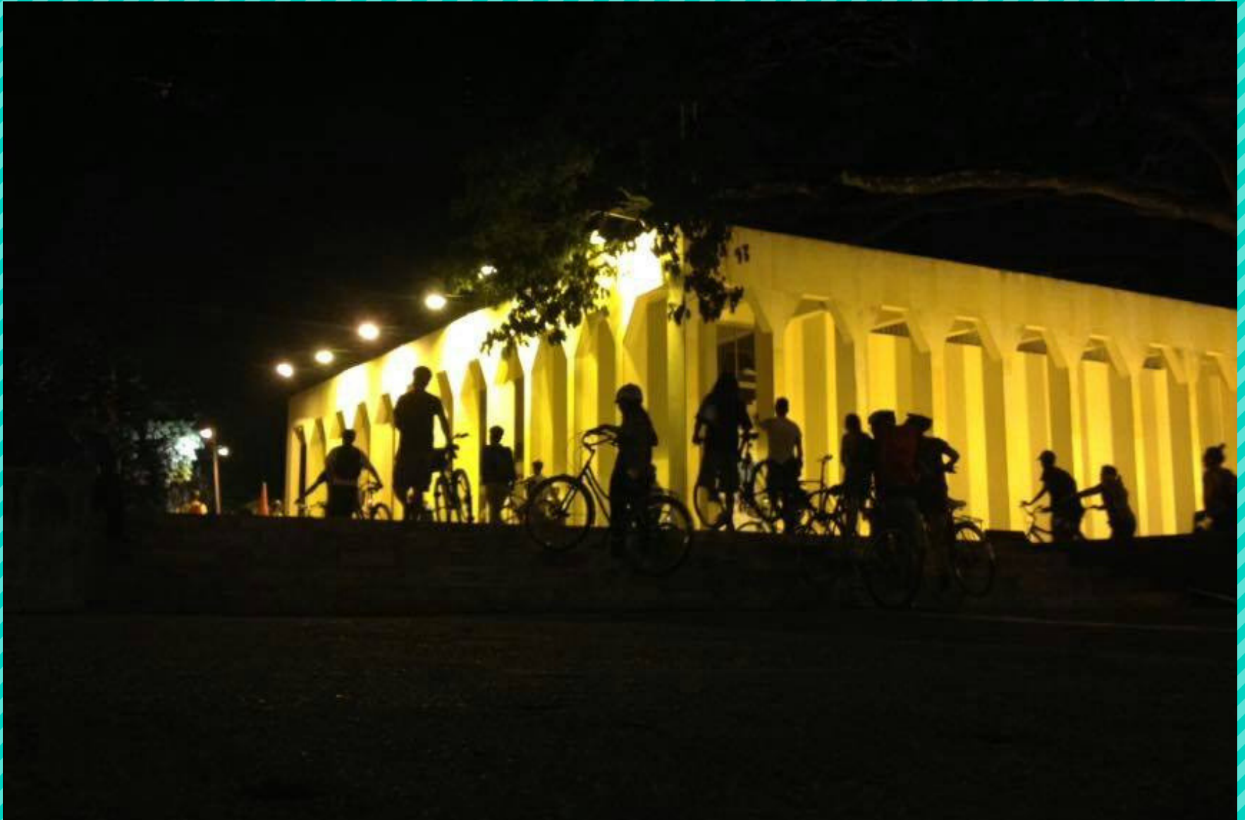
Museo la Tertulia, ¡Nos vemos en el río! (Cali, octubre de 2016)