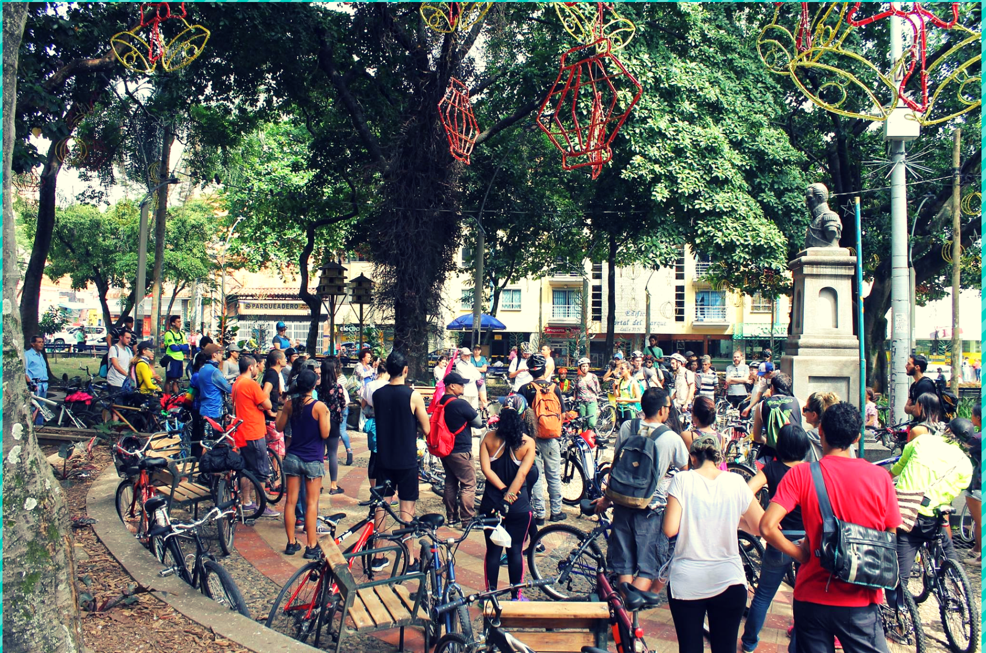
Parque de Belén, En busca de los gigantes invisibles (Medellín, noviembre de 2016)